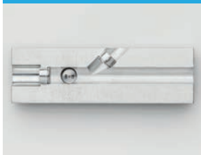
잠금 및 실링 시스템