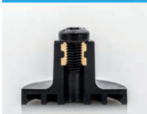
나사산 인서트 및 볼트