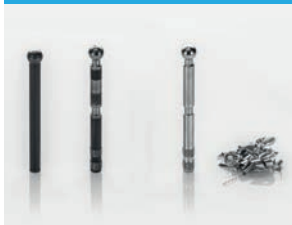
회전 부품 제조를 위한 기계 가공 없는 대안