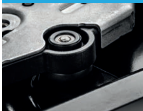
베어링 및 댐퍼